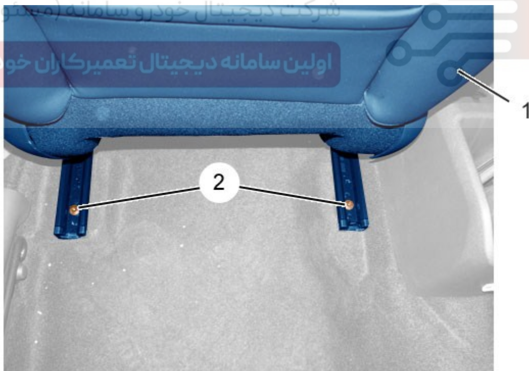
Figure : C5GG1BXD