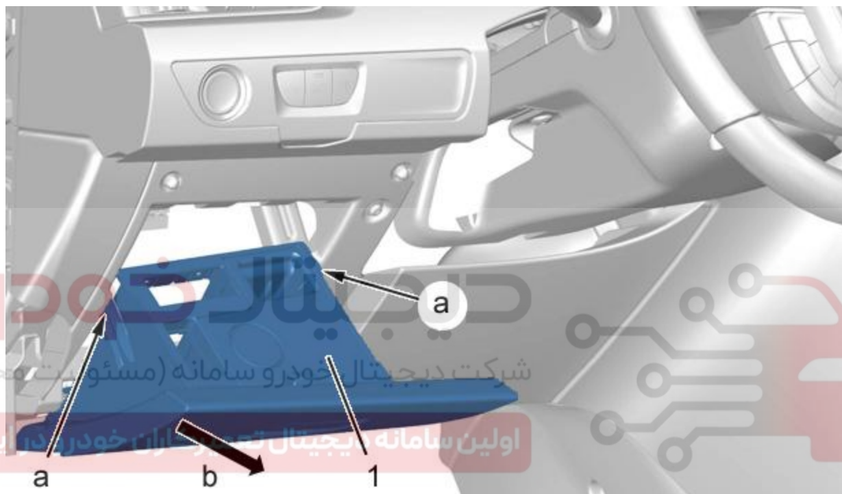
شکل C5FG1DSD :